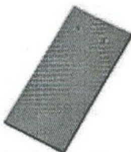
ȘIGLĂ SOLZ (DREAPTĂ)