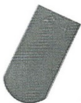
ȘIGLĂ SOLZ (ROTUNDĂ)